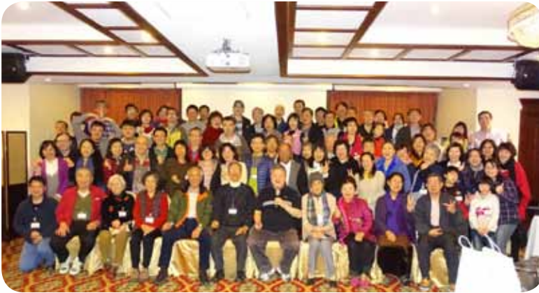
我們又在一起，相愛一家！