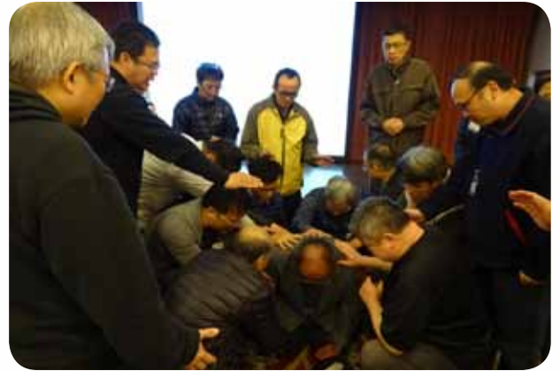
兄弟相愛憾山河！用實際的行動，為杜牧師的病痛守望。